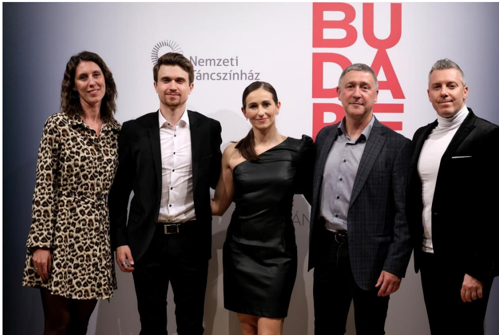
2025.05.06., Győri Balett közönségtalálkozó

A fesztivál 20 előadását, összesen 4121 fő tekintette meg.