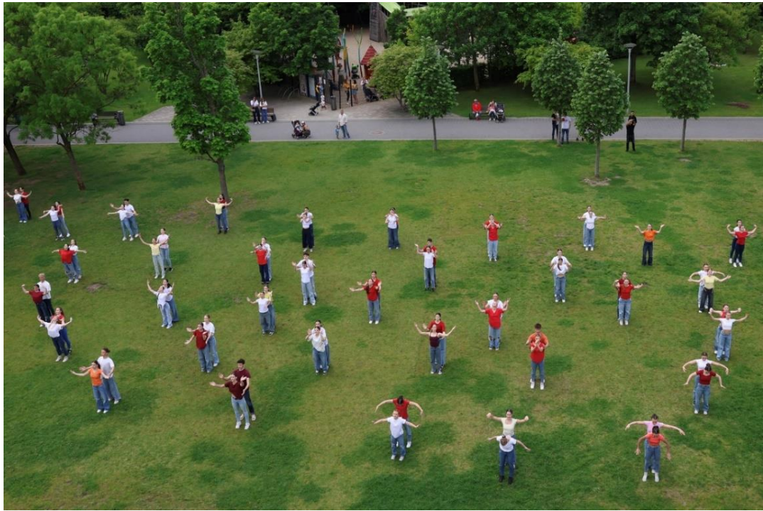
Tánc Világnapi sajtótájékoztató után előadott, a Táncszínház „Karöltve” című koreográfiájának bemutatója

"1100 éve Európában, 20 éve az Unióban" Karöltve című koreográfiája 74 pár előadásában