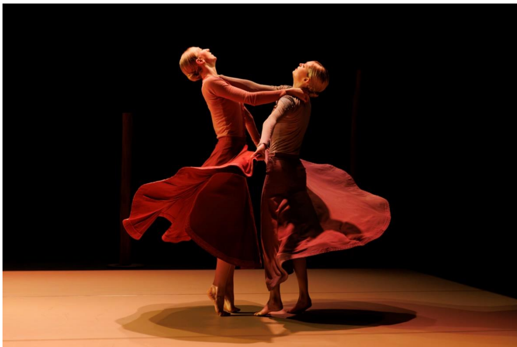
Gauthier Dance JUNIORS//Theaterhaus Stuttgart

A jubileumi fesztivál nemzetközi sztárfellépőkkel kápráztatta el a közönséget, köztük a világhírű Nederlands Dans Theater - NDT 2 társulattal, amely egy látványos, műfajfeszegető triptichonnal érkezett Budapestre.