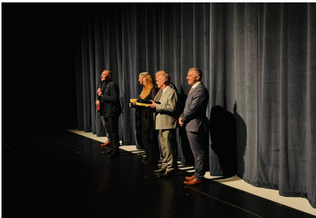
A Művészeti Tanács tagjai és a díjazott