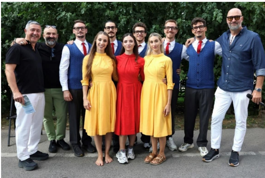
Szegedi Kortárs Balett a Pozsonyi Pikniken

A hagyományokhoz híven a Nemzeti Táncszínház is részt vett a rendezvényen, ahol a tánc iránt érdeklődők kedvezményes jegyeket és bérleteket vásárolhattak. Emellett a program művészeti élményt is kínált: a Szegedi Kortárs Balett egyik előadásának részletét mutatták be, így a látogatók ízelítőt kaphattak a kortárs táncszínház világából a 2025. évi eseményen.