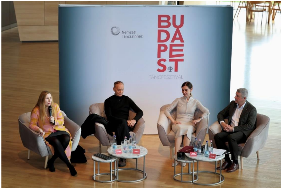
Magyar Táncművészek Szövetsége sajtótájékoztató, valamint a Karöltve c. koreográfia bemutatója 2025.04.29.