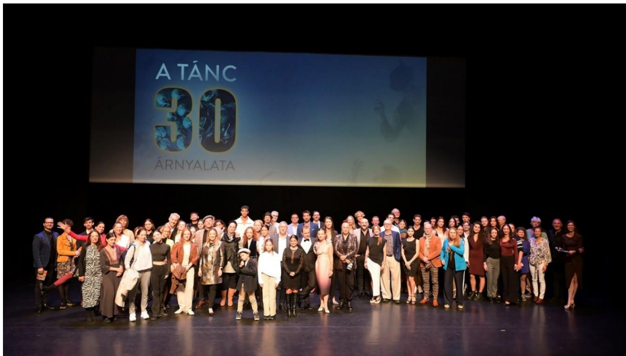
A film alkotói és szereplői

A filmet 2025-ben 4 alkalommal vetítettük a színházban, összesen 482 fő részvételével.