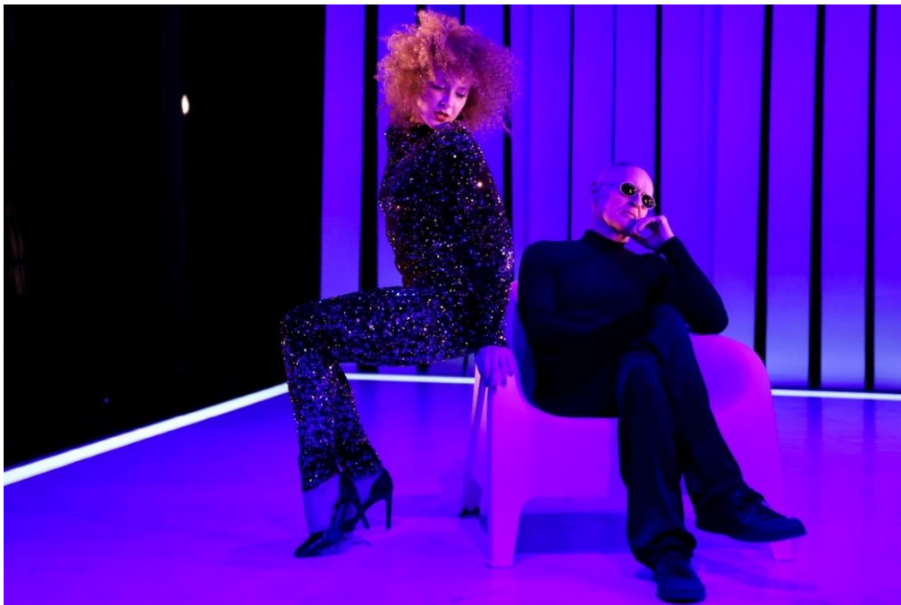
Frenák Társulat: Nostalg_Y

A közel egy évtized alatt, független finanszírozásból készült film Frenák Pál koreográfus kivételes életét és művészetét mutatja be. Az alkotók – élükön a New York-i producerrel, Vittoria de Bruinnel – óriási munkát végeztek, szívből gratulálunk a végeredményhez, és büszkék vagyunk, hogy a magyarországi premier a mi falaink között valósulhatott meg.