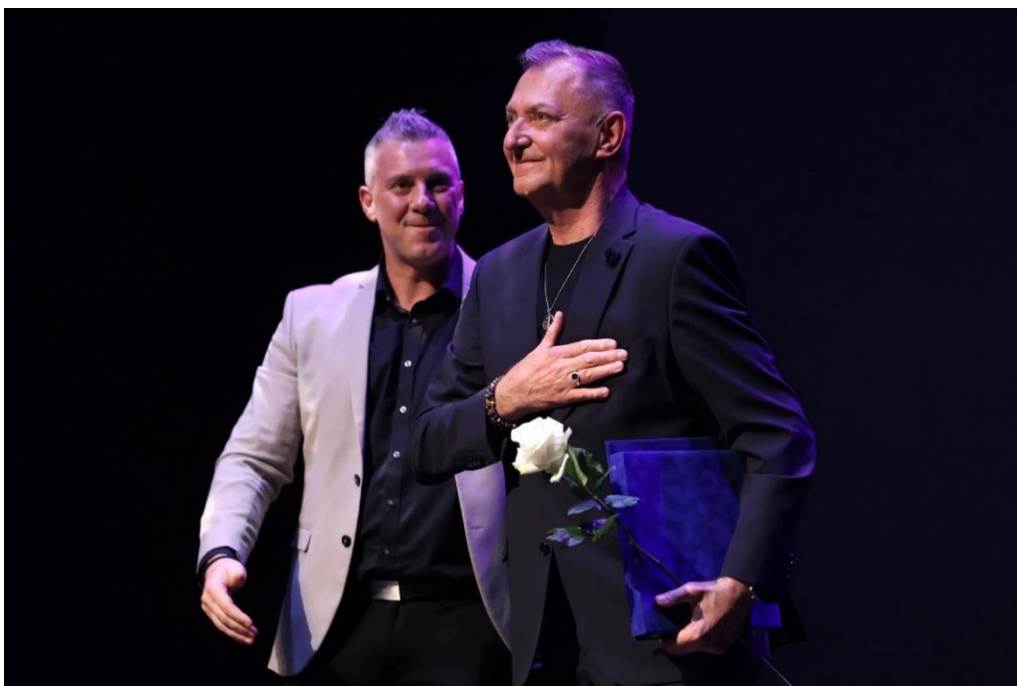
Tánc Világnapi díjátadó, 2025.04.29.

Április 29-én, a Tánc Világnapján közös gálaműsorra készült a Magyar Táncművészek Szövetsége és a Nemzeti Táncszínház. A Tánc Világnapján, a Szövetséggel együttműködve gálaestet szerveztünk, amely est keretében átadásra kerültek a Magyar Táncművészek Szövetségének szakmai díjait. Ugyancsak ezen az estén került sor az Imre Zoltán Alapítvány és az Ifj. Nagy Zoltán Alapítvány díjainak átadására is. A gálaesten, a díjátadásokat követően többek között, „2024 legjobb alkotója” díját elnyert koreográfus előadása került bemutatásra, a „Fekete hattyú” című darab, a Szegedi Kortárs Balett előadásában.